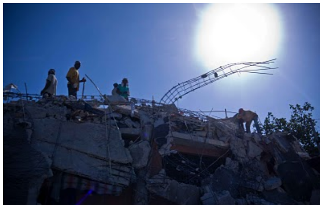
http://jeanfrancoislabadie.blogspot.com , 24 janvier 2010